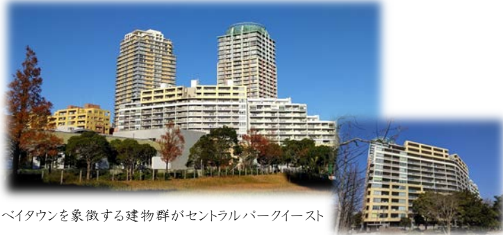
ペイタウンを象徴する建物群がセントラルパークイースト

きれいなケヤキ並木が心を和ませるセントラルパークエリア なかでもイーストエリアはペイタウンを一望できる場所に建つ建物群 特徴ある建物が織りなすペイタウンらしい雰囲気が感じ取れる場所