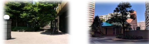
ケヤキ並木道の雰囲気が素敵 セントラルパークは共用施設も充実